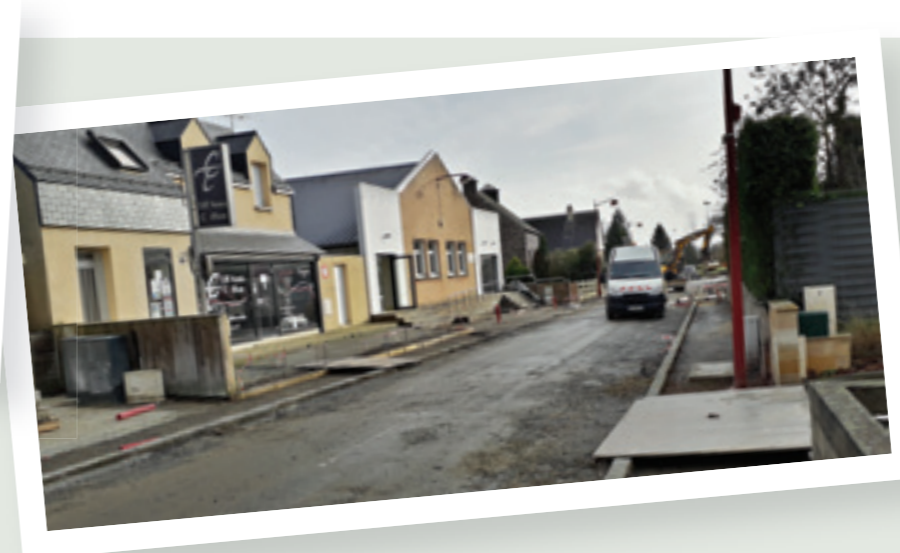
Travaux 2018 de la rue de Rennes.