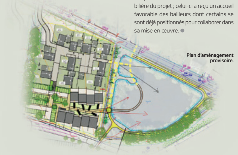
Plan d'aménagement provisoire.

Des rencontres avec les bailleurs sociaux ont permis de vérifier la faisabilité immobilière du projet ; celui-ci a reçu un accueil favorable des bailleurs dont certains se sont déjà positionnés pour collaborer dans sa mise en œuvre.