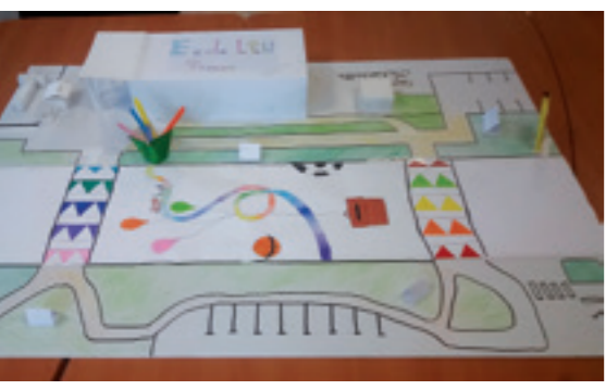
Maquette réalisée par le CMJ.